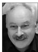
af Roy Stemman, redaktør

Hans mange detaljerede udsagn er blevet bekræftet.