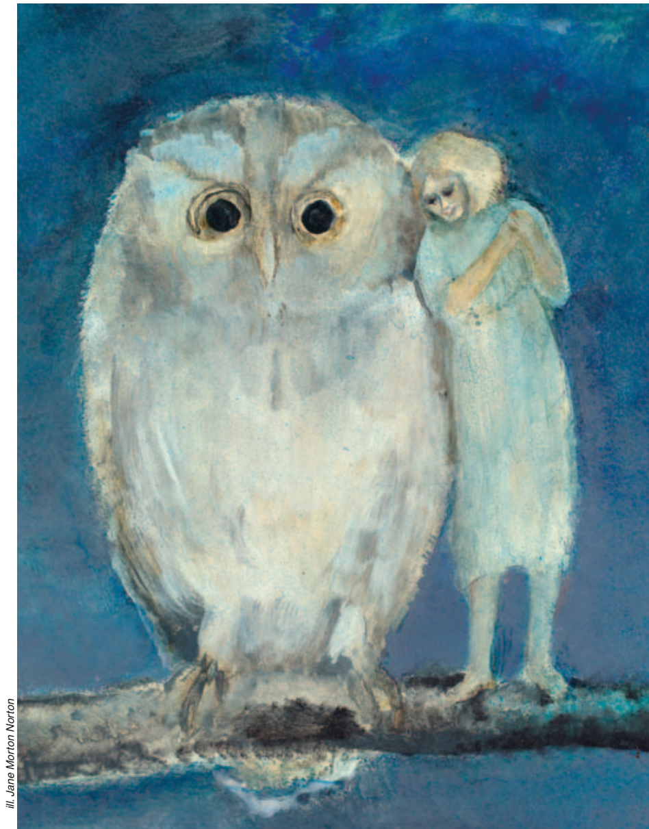
”Uglen rolige, bevidste blik på så kort afstand var næsten overjordisk.”

Læs også artiklen De mødtes i drømmeland af Steen Landsy i NA 2/08 eller via www.nytapekt.dk/jan2015gl